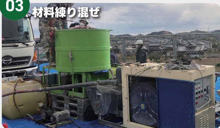
モルタルミキサーに既定量の水を溜め、珪砂・白セメント・着色剤・混和剤を投入して十分に練り混ぜる。