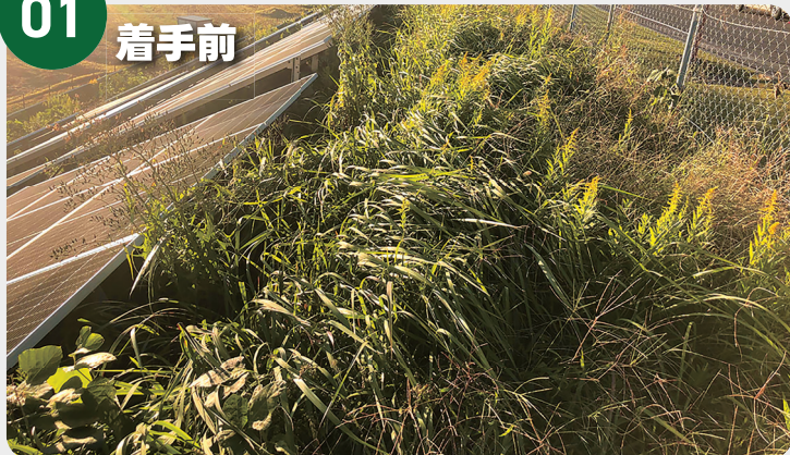
雑草が生えている状態。