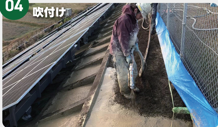
施工箇所まで吹付ホースを延長しておきモルタルポンプにより基材を圧送して万遍なく吹付ける。